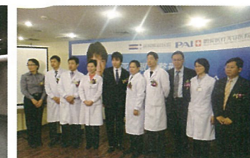
美容医療をもっと世に広めるべく、日本全国のみならず海外でも積極的にセミナーなどを開催。「今注目しているのは海外の新しいタイプのヒアルロン酸。肌表面を締め内側からふっくら肌へ導くという優れたものです」