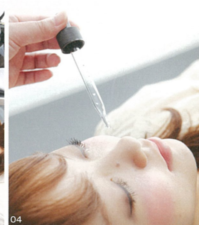
04. レーザー照射後は患者の希望に合わせて成長因子を導入。これを入れることでダウンタイムが減り、肌再生をサポートする。