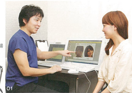
01. カウンセリングで現在の肌の状態、患者が抱えている肌悩みなどを確認。施術内容もしっかり説明する。