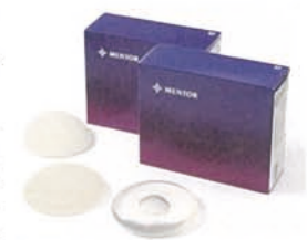
(奥から)アナミカル型、ラウンド型 テクスチャードタイプ、ラウンド型スムースタイプ

銀座・いけだクリニックが使用するのは、欧米はもとろ、ん世界でNo.1シェアを誇るMENTOR社製。ティアドロップのような形で彫刻のように美しい胸を作る「アナミカル型」と、重力の影響で緩やかに形が変化する「ラウンド型」があり、各々数サイズ用意されている。