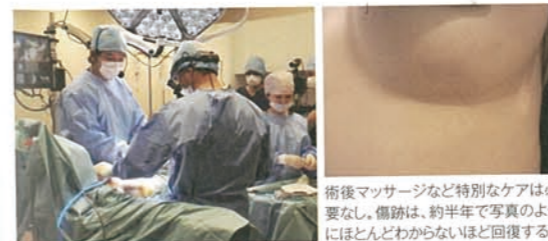
術後マッサージなど特別なケアは必要なし。傷跡は、約半年で写真のようにほとんどわからないほど回復する。

熟練した医療スタッフによる管理のもと、安全に手術を行う。独自の技術により乳房内からつり上げ、美しいボリュームを形成。切開は乳房下から行い、3~6カ月でほとんど目立たなくなる。