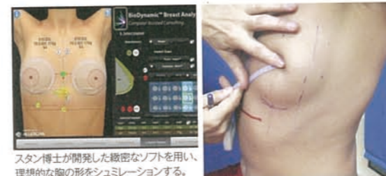
スタン博士が開発した緻密なソフトを用い、理想的な胸の形をシミュレーションする。

乳頭の位置や乳房の形を綿密に計測。正面・左右から胸を撮影し、患者自身も客観的に術前状況を把握する。また、大胸筋の位置も確認。年齢とともに下垂した筋肉状態も加味して、手術方針を決定する。