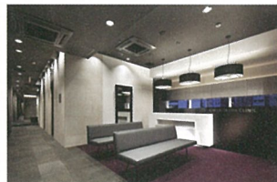
2010年に移転リニューアルした院内。手術室にはドイツTRUMPF社製の無影灯を採用するなど最新設備が整っている。