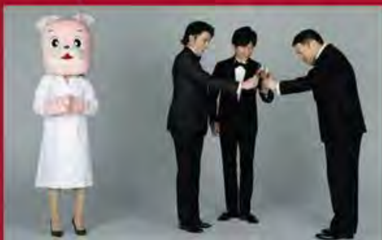
卯辰先生は昨年12月に美STの「美容医療界No.1インフルエンサー」に選出された。この栄誉は、17年間にわたる読者からの愛と信頼の賜である。

銀座お肌の診療所 中央区銀座2-2-17有楽町ビル5F ☎0120-084-112 ミックスピール ¥6,800(2回目以降 ¥6,120)、マッサージピール ¥16,000(2回目以降 ¥14,400)、ミルクピール ¥9,800(2回目以降 ¥8,820)