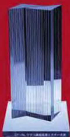
建築家 隈研吾先生