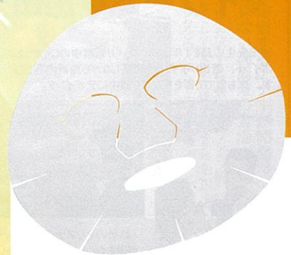
【ベビーペプチドマスクパック】