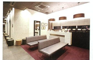
東京皮膚科・形成外科

中央区銀座2-11-8 ラウンドクロス銀座3F ☎03-3545-8000 世界中から話題の治療を導入中。「すべてを試さないといけない悪も評価できない」という信念のもと日本の美容医療業界のトップを独走中。「患者さんに無駄な治療費を払ってもらいたくない」という思いから池田先生の探求心は止まりません。マッサージピール+ベビーペプチドマスクパック¥18,000