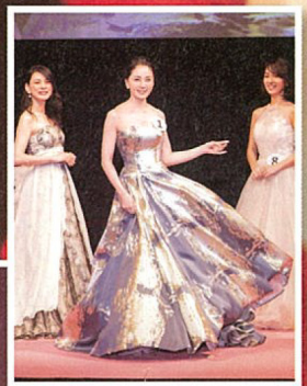
ドレスでのステージワークで流麗な所作を披露。エレガントな振る舞いに観客席からもため息が。