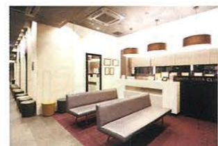
東京皮膚科・形成外科

中央区銀座2-11-8 ラウンドクロス銀座3F ☎03-3545-8000 フェイスタイト額・顎下・首1部位各¥180,000、同日に2部位¥300,000、同日に3部位¥350,000、同日にフラクトラ¥100,000。顎下が一番人気。脂肪吸引と一緒にする場合もあり。ダウンタイムが少なくなるようにと池田先生の研究熱意は半端なし。日を迫うごとにその成果はアップデート中。