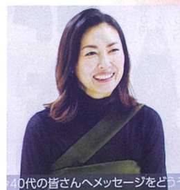
40代の皆さんへメッセージをどうぞ