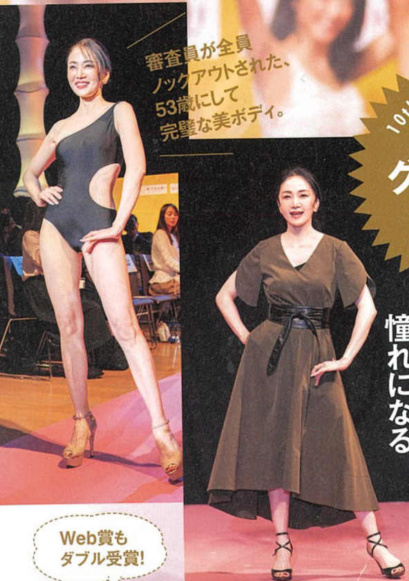
審査員が全員 ノックアウトされた。 53歳にして 完璧な美ボディ。