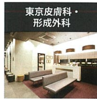
東京皮膚科・形成外科

中央区銀座2-11-8 ラウンドロス銀座3F ☎03-3545-8000 ベビーペプチド点滴(歯髄) 一本¥50,000、ベビーペプチド注射(歯髄)によるAGA治療・部分注射¥50,000、シルファーム全額¥50,000 現在の日本の最新美容医療トレンドの発信源。池田先生アンテナに益々期待。