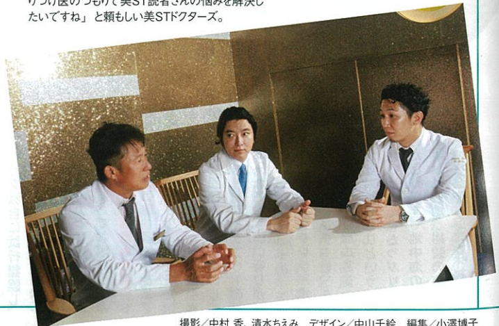
デザイン/中山千絵 編集/小澤博子

「まだまだ気が抜けない大変な時期が続きますけど、『美』を楽しみながら乗り切りましょう。かかりつけ医のつもりて美ST読者さんの悩みを解決したいですね」と頼もしい美STドクターズ。