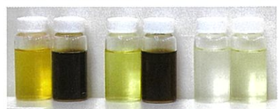
左はビタミンC、中央は他のビタミンC誘導体、右が中性ビタミンC。50℃で4週間たっても中性ビタミンCは色がほぼ変わらず安定。