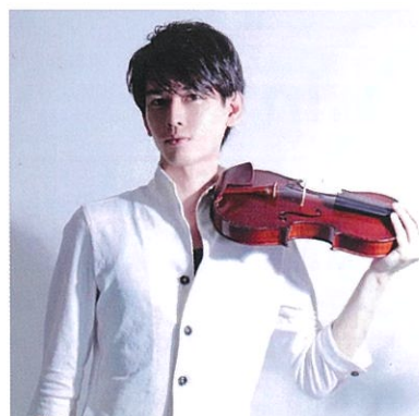
Beauty Noise Tokyo